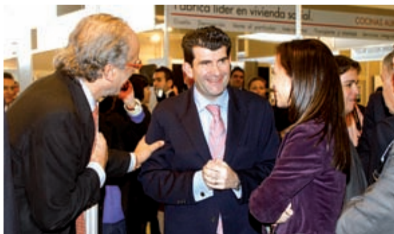
El alcalde de Alcalá de Henares y presidente de la Federación de Municipios, Bartolomé González.