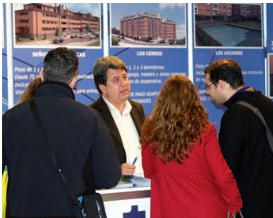
La diversificación de la oferta en precios y zonas fue uno de los factores positivos más destacados por los visitantes.