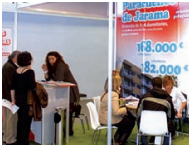
Imagen del expositor de Premier con viviendas en Paracuellos de Jarama.