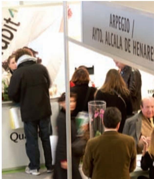
Se percibió un fuerte interés por la vivienda protegida entre los visitantes.