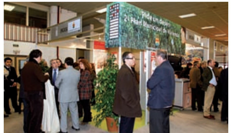
Alcortón es uno de los municipios con mayor oferta de vivienda social de Madrid.