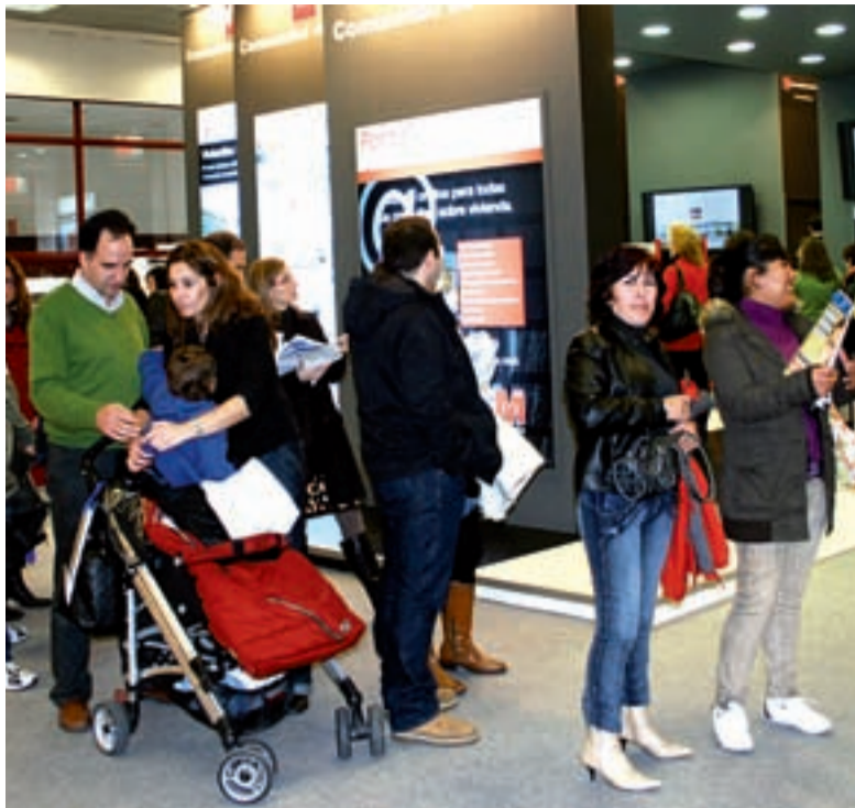
Familias, jóvenes, inmigrantes, esperan su turno en el Ayuntamiento de Madrid.