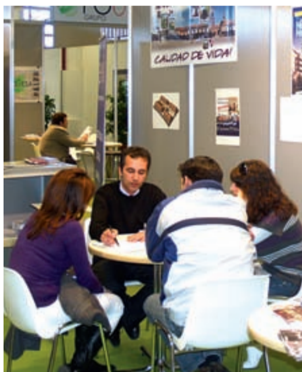
Navalcarnero estuvo presente a través de las promociones de Aegis.