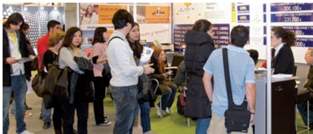
La estampa típica del salón: colas de jóvenes en busca de la oferta de vivienda adaptada a sus necesidades.