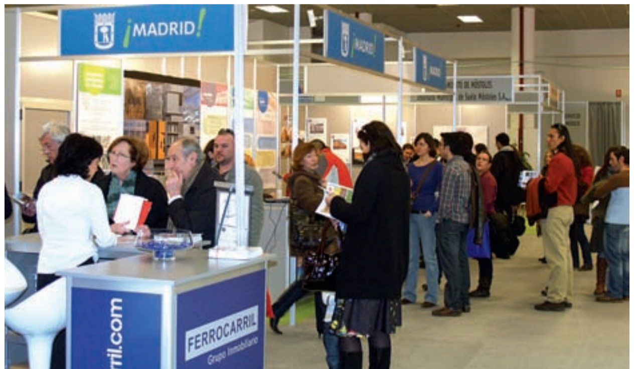
El expositor del Ayuntamiento de Madrid fue uno de los que recibió un mayor número de visitantes durante los tres días del Salón.