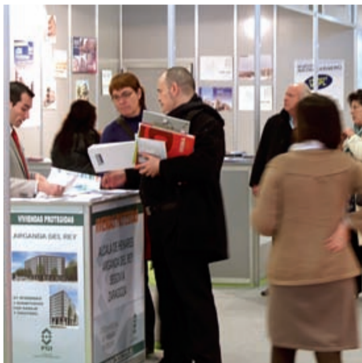
A diferencia de otras ferias y salones, los visitantes vieron más importante los "papeles".