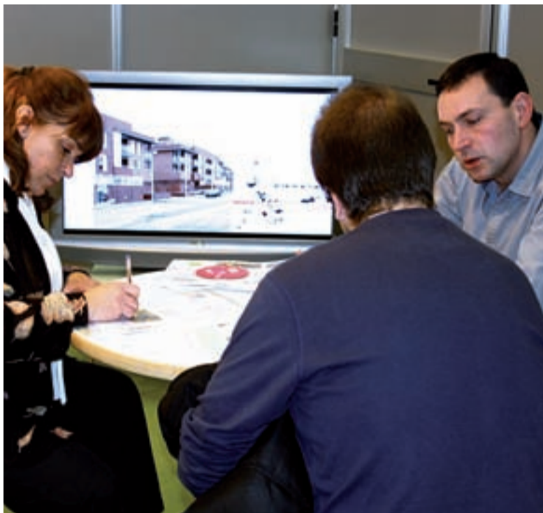
La información personalizada fue muy valorada por los visitantes que acudieron al Salón.