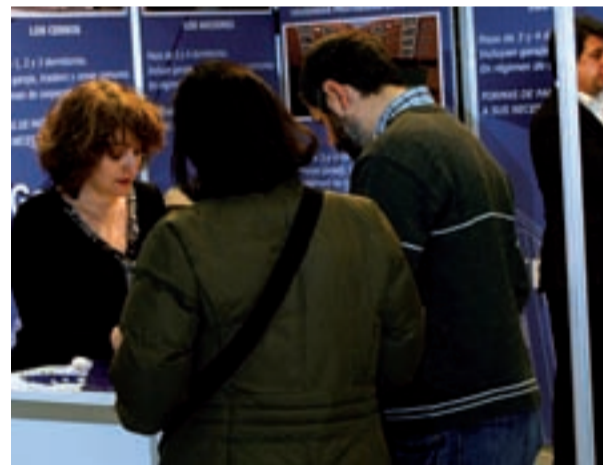
Los visitantes requerían toda la información posible.