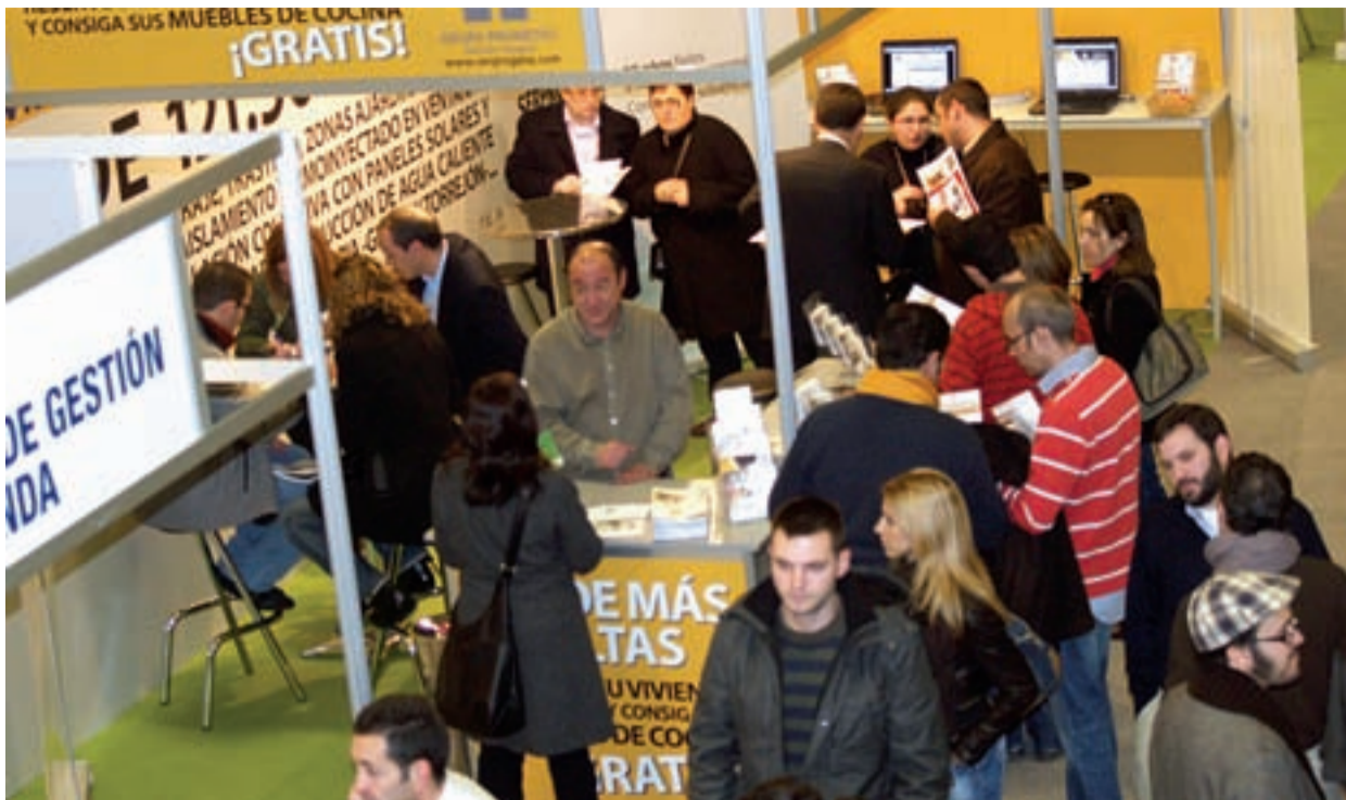
Los expositores destacaron que los visitantes llegaron al Salón con las ideas muy claras en cuanto a la tipología y precio de la vivienda que buscaban.