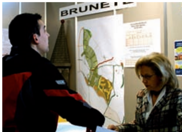
Brunete ofreció información sobre sus promociones en marcha.