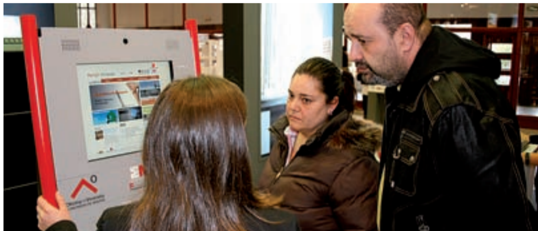
Terminal interactivo de información al ciudadano de la Comunidad de Madrid.