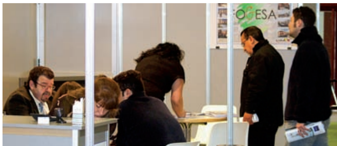
La actividad de los expositores aumentó de forma importante el sábado y domingo como se ve con la empresa Fogesa.