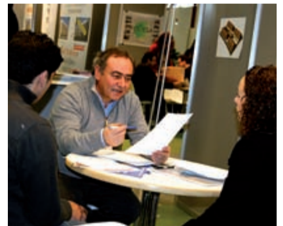
Una pareja interesada por la oferta de viviendas.