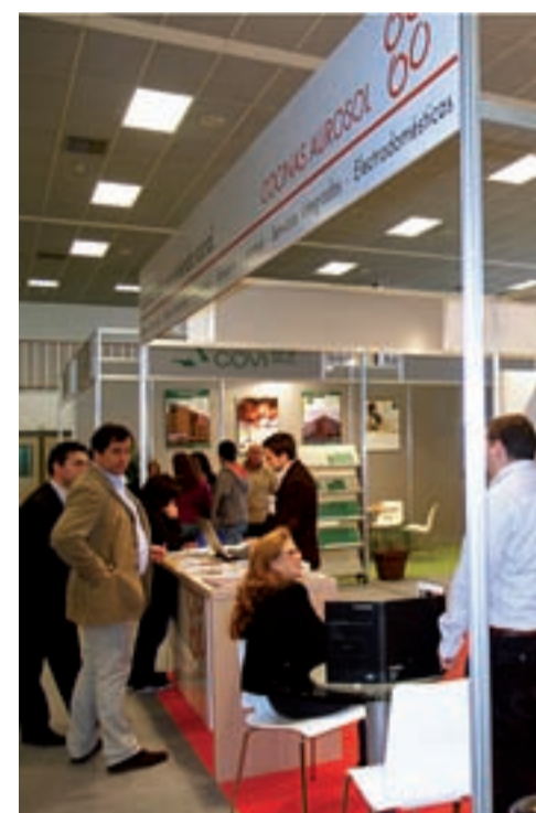
Los muebles de cocina de Aurosol también tuvieron su sitio.