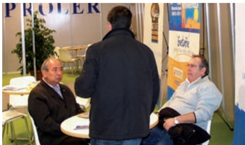
El Ayuntamiento de Getafe expuso sus políticas de vivienda.