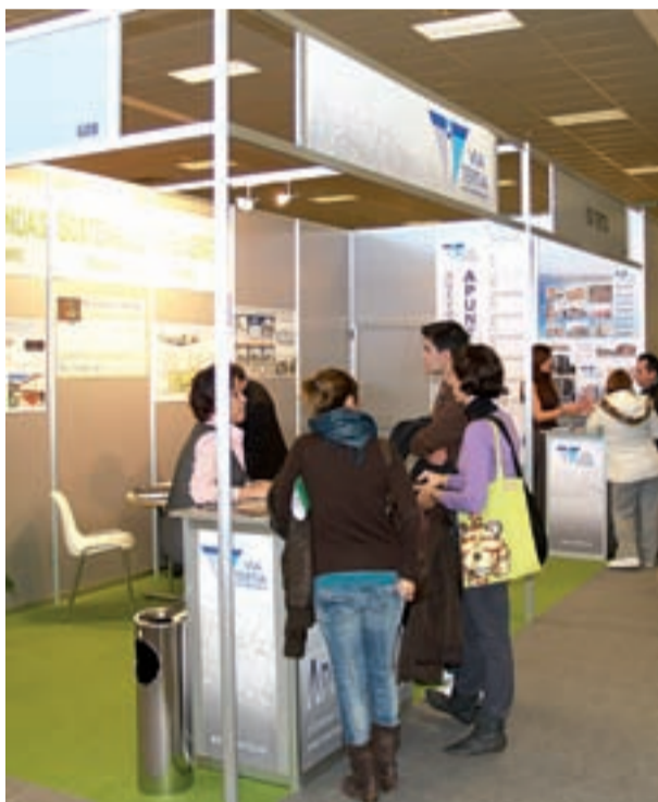
Via Tertia mostró su oferta de vivienda en la Comunidad.