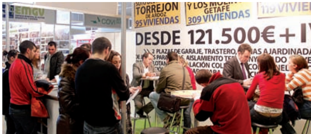
El primer Salón de la Vivienda Social, Asequible y Sostenible ofreció posibilidades de promociones para todos los bolsillos