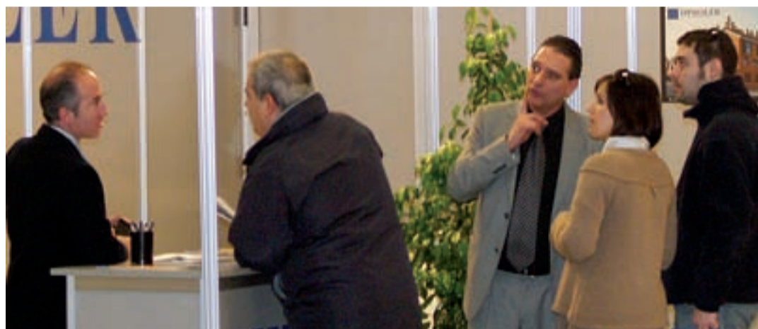
Oproler mantuvo importantes contactos con las gestoras de cooperativas presentes en el Salón.