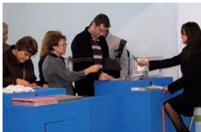
En los expositores los visitantes podían encontrar toda la información de las promociones.