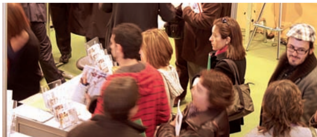
El Salón alcanzó su principal objetivo: ser un punto de encuentro entre oferta y demanda de vivienda social y asequible.