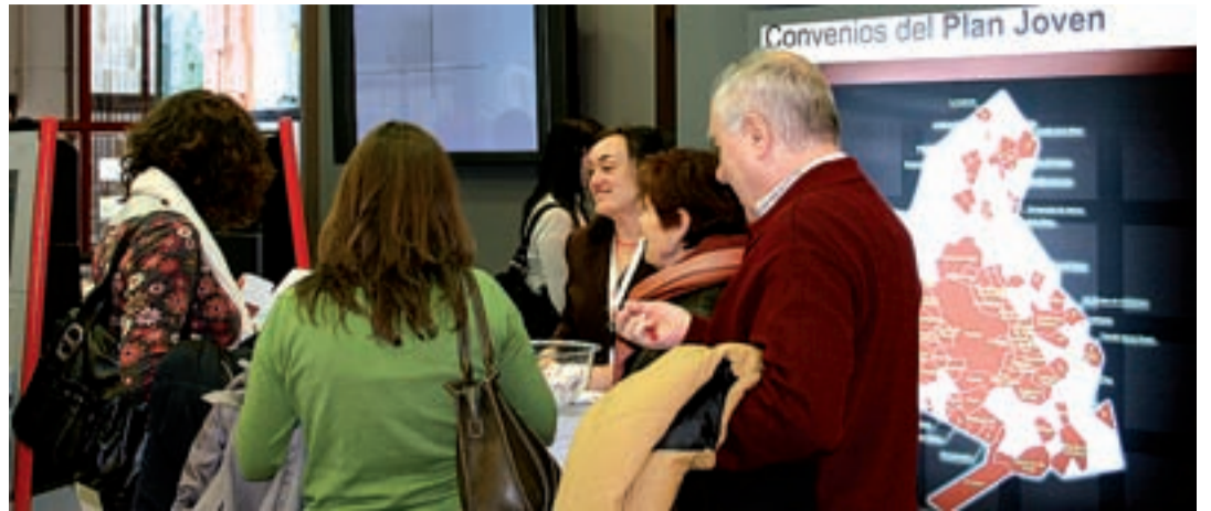
La Comunidad de Madrid ofreció durante el salón información sobre los procesos abiertos de vivienda protegida.