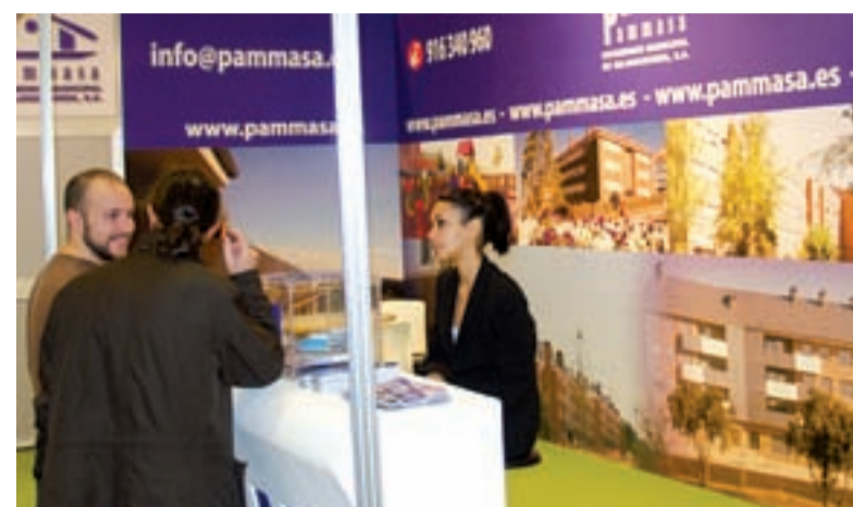
La empresa pública de Majadahonda tuvo la posibilidad de ofrecer información de primera mano.