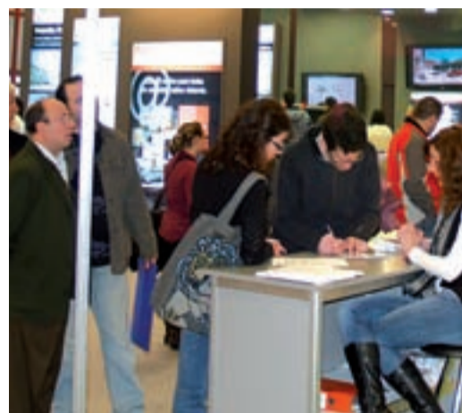
Muchos visitantes se interesaban por el alquiler.